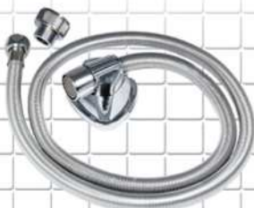
شلنگ توالت سیمی سفید ABS TOILET HOSE White tubing ABS نحاس المرحاض الرذاذ خرطوم أبيض أنابيب ABS