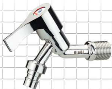
شیر شلنگی ربع گرد (لادن) CERAMIC HOSE BIBCOCE (LADAN) السیرامیک الخرطوشه خرطوم (لادن)