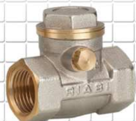
شیر یک طرفه ONE SIDE VALVE نحاس الصمامات 1 لطريقة