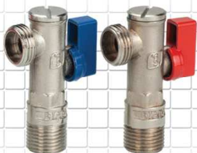
شیر پیسوار فیلتردار FILTERED BRASS ANGLE VALVE مصقول النحاس زاوية صمام