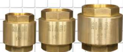
شیر یک طرفه فنی ONE WAY VALVE نحاس الصمامات 1 لطريقة