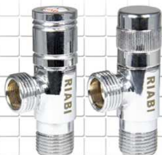
شیر پیسوار ربع گرد دسته کرومی CHROMIUM HANDLE CERAMIC ANGLE VALVE روم مصقول صمامات سيراميك زاوية السباكة