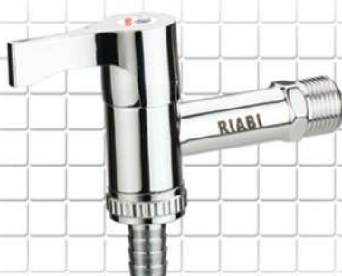
شیر شلنگی (کلیدی) HOSE BIBCOCK صمامات الخرطوم