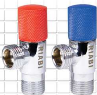
شیر پیسوار ربع گرد دسته رنگی COLORED HANDLE CERAMIC ANGLE VALVE ملون مقبض سيراميك زاوية صمام