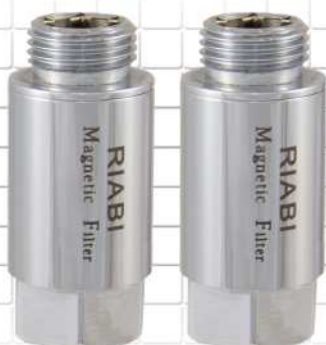
فیلتر مغناطیسی برنجی MAGNETIC BRASS FILTER نحاس المصقول مغناطیسی