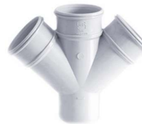
چهارراه ۴۵ درجه .