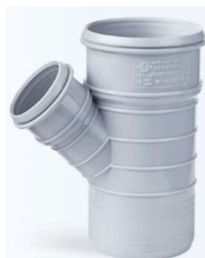
سه راهی تبدیل ۴۵ درجه .