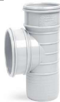
سه راهی ۹۰ درجه .