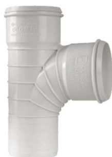
سه راهی خم ۸۷/۵ درجه .