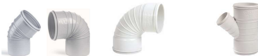
سه راهی تبدیل ۴۵ درجه سه سر کوپله . زانوی خم ۸۷/۵ درجه دو سر کوپله . زانوی ۹۰ و ۴۵ درجه ناودانی

با توجه به نوسانات قیمت، قبل از ثبت سفارش از آخرین تخفیفات واحد فروش اطمینان حاصل فرمایید. (۱۴۰۱/۰۶/۰۶)