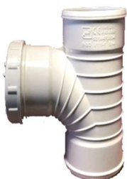
سه راهی ۸۷/۵ درجه دریچه بازدید دو سرکوپله .