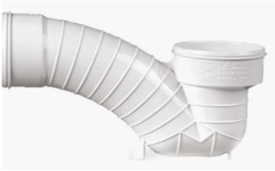
سیفون کامل .