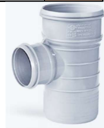
سه راهی تبدیل ۹۰ درجه .