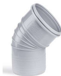
زانوی ۴۵ درجه .