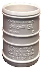
گوپلینگ بدون ترمز .