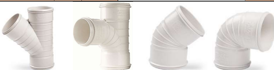
زانوی ۹۰ درجه دو سر کوپله . زانوی ۴۵ درجه دو سر کوپله . سه راهی خم ۸۷/۵ درجه سه سر کوپله . سه راهی ۴۵ درجه سه سر کوپله