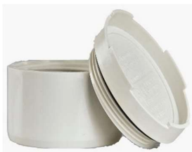
دریچه بازدید توپبچ .