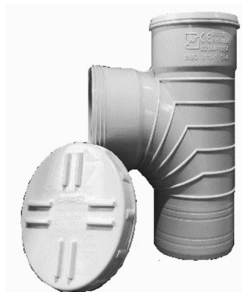
سه راهی ۸۷/۵ درجه دریچه بازدید.

با توجه به نوسانات قیمت، قبل از ثبت سفارش از آخرین تخفیفات واحد فروش اطمینان حاصل فرمایید. (۱۴۰۱/۰۶/۰۶)