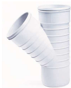
سه راهی ۴۵ درجه .