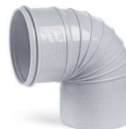
زانوی ۹۰ درجه .

با توجه به نوسانات قیمت، قبل از ثبت سفارش از آخرین تخفیفات واحد فروش اطمینان حاصل فرمایید. (۱۴۰۱/۰۶/۰۶)