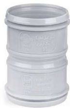
کوپلینگ ترمزدار .