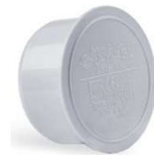
درپوش توکار .