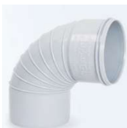
زانوی خم ۸۷/۵ درجه یک سر کوبله .