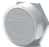
درپوش روکار .