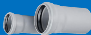
لوله یک سر سوکت