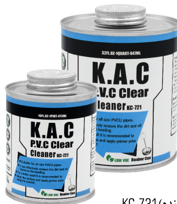
۱ کلینر (تمیزکننده) KC-721

پس از خشک شدن تمیزکننده کی ای سی، سایر مراحل آماده سازی و چسباندن انجام شود.