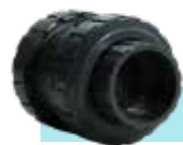
شیر یکطرفه U-PVC فنردار