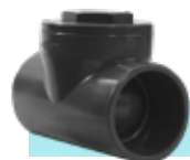
شیر یکطرفه U-PVC دریچه‌ای