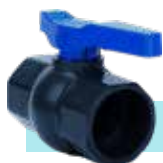
شیر تویی U-PVC چسبی