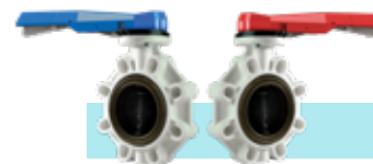
شیر پروانه ای U-PVC