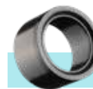
تبدیل U-PVC چسبی