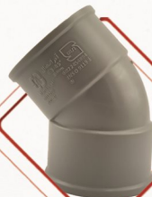
زانو دوسر کوپل