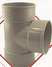
سه راه سه سر کوپل