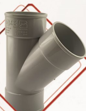
سه راه سه سر کوپل