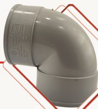
زانو دو سر کوپل