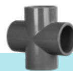
چهارراه ۴۵ درجه U-PVC