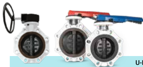
شیر پروانه‌ای صنعتی U-PVC