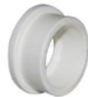
فلنج پلی پروپیلن