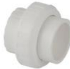
مهره ماسوره پلی پروپیلن