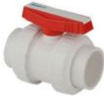
شیر توپی پلی پروپیلن